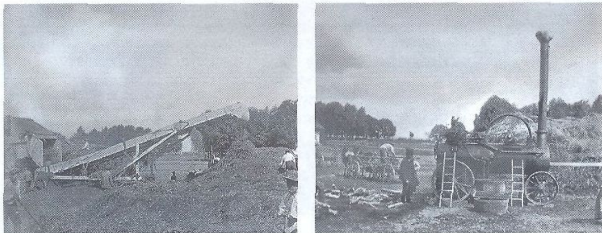
Сельскохозяйственные работы в усадьбе. 1910-е гг.

Через несколько лет в Городке появилась своя конюшня, а затем и конный завод с племенными лошадьми рысистой породы и производителем, купленным на выставке в Петербурге. Были реставрированы старые мельницы и построены новые – общим числом 9. В помещичьих лесах появилось нововведение, ранее не виданное в крае: рубка леса узкими 20-саженными деланками, прореживание молодой поросли, посев желудей, посадка молодняка и созданный для этих целей специальный питомник ценных пород деревьев. В имении было введено 11-польное хозяйство, приносящее существенный доход. А в 1902 г. в Городке было предпринято строительство образцовой фермы на приусадебном поле в 40 десятин. Половина большой каменной постройки, воздвигнутой в центре участка, пошла под маточную конюшню с просторными денниками, вторая половина – под коровник. В коровнике, населенном животными «швицкой породы», ясли тянулись вдоль центрального прохода, что позволяло наполнять их кормом прямо с телеги. В обе половины постройки была проведена вода, устроены стоки для нечистот и прочие приспособления, делавшие ферму сельскохозяйственной диковиной. Виноградский писал о своем образцовом хозяйстве в 1940-е гг., проживая уже во Франции: