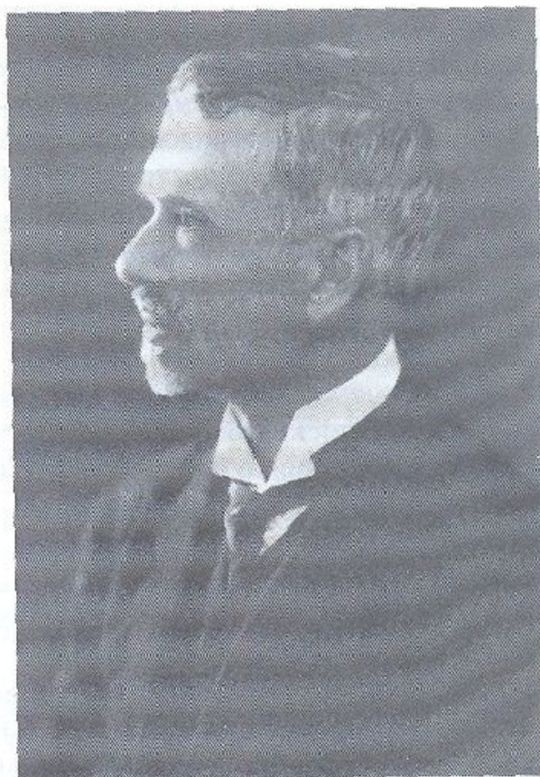
С. Н. Виноградский в возрасте около 60 лет

Самым заманчивым из последовавших приглашений было переданное через И. И. Мечникова приглашение Пастера переехать в Париж для работы в Пастеровском институте. Почти одновременно из Петербурга от принца А. П. Ольденбургского пришло предложение возглавить Отдел общей бактериологии в только что образованном Императорском Институте экспериментальной медицины. Не желая терять связь с Россией, Сергей Николаевич выбрал Петербург. Институту экспериментальной медицины он посвятил почти 15 лет жизни, но к 1905 г. в его жизни наступает творческий и моральный кризис, в результате которого он оставляет науку и удаляется в Городок – свое имение в Подолии. Здесь он вплоть до своей вынужденной эмиграции в январе 1920 г. занимается исключительно хозяйством и предпринимательской деятельностью. Революция и гражданская война заставили его спешно покинуть родину и уехать в Европу. Попытка обосноваться в Белграде не принесла ему должного удовлетворения, поэтому в 1922 г. Виноградский с радостью принял предложение директора Института Пастера в Париже Э. Ру возглавить отделение почвенной микробиологии и поселиться в Бри-Комт-Робер под Парижем. Так желание Пастера 30-летней давности иметь в своем институте Виноградского оказалось, можно сказать, реализованным. Остаток своей долгой жизни (а прожил он 96 лет) Сергей Николаевич занимался