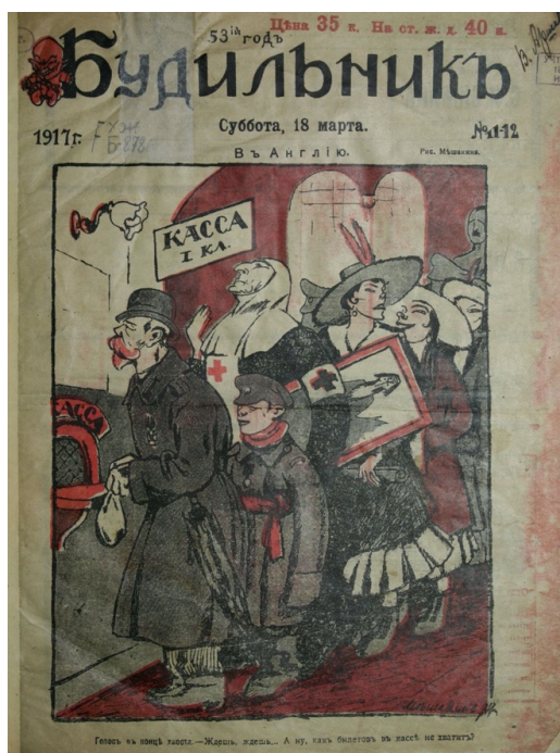
Обложка журнала «Будильник». Подпись: «В Англию. Голос в конце хвоста: – Ждешь, ждешь... А ну, как билетов в кассе не хватит?» [1917. № 11–12. С. 1].

страницы периодических изданий. Тема Распутина оставалась весьма ходовой – его убийство, похороны, проведение «спиритических сеансов», близость к царской семье. Чем больше новых деталей разгульной жизни Распутина публиковалось, тем бóльший интерес читателей это вызывало.