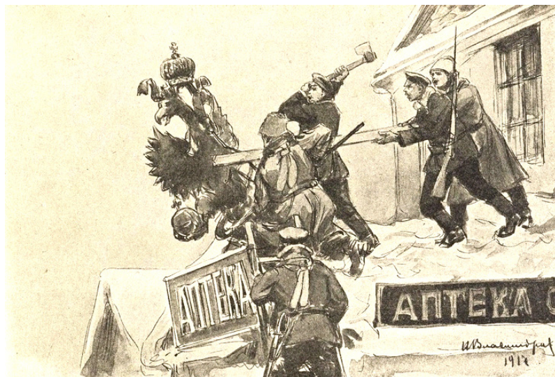
«Уничтожение орлов и вензелей»

«Да здравствует освобожденная Россия! Да здравствует Народное Правительство! Да здравствуют Армия и Флот!» – крупными буквами красовались заголовки в газете «Утро России» от 2 марта 1917 г. «Да здравствует свободная Россия!», – декламировал «Петроградский листок» 5 марта 1917 г., публикуя манифест об отречении императора Николая II. В манифесте речь шла о необходимости ведения войны до победного конца и сплочении народных сил: «В эти решительные дни в жизни России сочли мы долгом совести облегчить народу нашему тесное единение и сплочение всех сил народных для скорейшего достижения победы и в согласии с Государственной Думой признали мы за благо отречься от престола Государства Российского и сложить с себя верховную власть» [Петроградский листок 1917, с. 1]. Манифест печатался и перепечатывался в газетах и в виде отдельных оттисков, новость молниеносно распространилась в Петрограде и Москве.