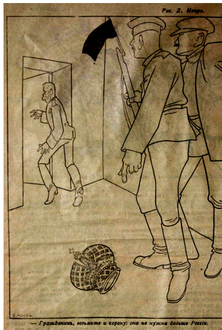
Рисунок из журнала «Будильник». Подпись внизу: «Гражданин, возьмите и корону: она не нужна больше России» [1917. № 11-12. С. 4].

Романова. Его больше нет, и как бы ни молились святые игумены о его здравии, ему уже не воскреснуть» – такими словами начиналась статья о расстреле бывшего царя [Правда 1918, с. 1]. Общий тон сообщения был уничижительным, о чем свидетельствуют и подбор лексики («матерый помещик», «облезлая корона», «пустая голова»), и недвусмысленные характеристики («фигура жалкая», «символ звериного режима крови и насилия над народом», «ставленник диких помещиков» и т.д.), и дальнейшие рассуждения о бесполезности его царствования. Подборка событий правления была составлена исключительно из отрицательных эпизодов: Ходынка, Кровавое воскресенье, проигрыш в Русско-японской войне, Азефовщина, деятельность Столыпина-вешателя, дело Бейлиса, развязывание мировой войны, шарлатанство Распутина и т.д. В некоторых случаях были нарушены причинно-следственные связи или даже допущены фактические ошибки (например, упоминалось о помазании на царство и Ходынской катастрофе при вступлении Николая II на престол в 1894 г.; однако если вступление на престол действительно произошло в 1894 г., то коронация состоялась двумя годами позже – в 1896 г.), но это никого не смущало. Расчет делался на негативный эмоциональный эффект.