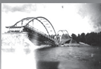
ИСТОРИЯ ПАРТИЗАНСКОГО ДВИЖЕНИЯ