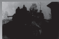
БИТВЫ (БОЕВЫЕ ОПЕРАЦИИ) ВЕЛИКОЙ ОТЕЧЕСТВЕННОЙ ВОЙНЫ