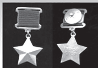
ГЕРОИ СОВЕТСКОГО СОЮЗА