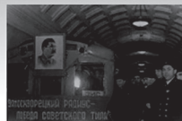
ТЫЛ И ЭКОНОМИКА